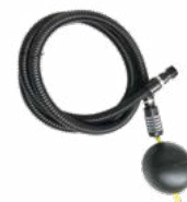
5. 7089 Set filtre d'aspiration 1" slim rain