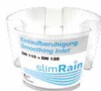
3. 7076 Ralentisseur à l'entrée 110/125