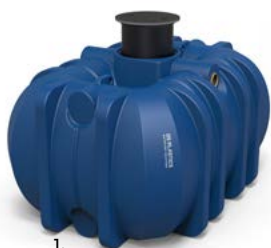
1. 9237 Easy Rain 10000 cuve eau de pluie 10 000l plat