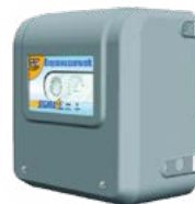
4. 5388 Système sigma 4bar