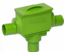
2. 6089 Integral filter Ø160