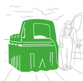
stookolie- en opslagtanks cuve à fioul et stockage